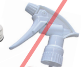
Handsproeiers en pompjes