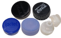
Melk, fruitsap, water, frisdrank, sportdrank