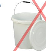
Doppen groter dan 30 cm doorsnede